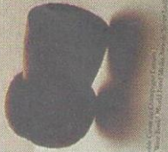
ILLUSTRATION BY PIERRE FERREY. SPARKLING WINE: COURTESY OF CHAMPAGNE HOUSES. PHOTOGRAPHY: ANDREW HARRIS. WORLD ENCYCLOPEDIA OF CHAMPAGNE AND SPARKLING WINE: COURTESY OF THE CHAMPAGNE HOUSES.

FULLY REVISED AND UPDATED BY ESSI AVELLAN M.V.